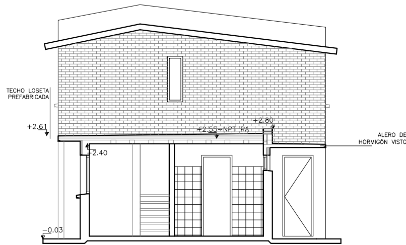
BLOQUE G- CORTE 2 ESC. 1/100